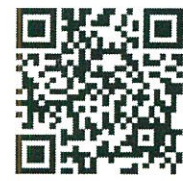
แบบเข้าร่วมประชุม (๑) กำหนดการประชุม (๒) แบบลงทะเบียนเข้าร่วมประชุม (๓)